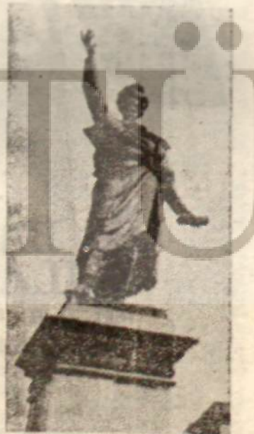
Petöfi'nin birçok yerde anıtı dikilmiştir. Ünlü ozan 26 yaşındayken öldürülmüştür..

Mate, bana bir resmini imzalamış. Bir de küçük plâk almış Bela Bartok'dan. Buluşmayı kısa kestik. Ertesi sabah 5.30 da istasyonda olacaktık. Trenimiz 6.00'ya doğru kalkıyordu. Öyle yaptık. Elimizde birer bula. Yine Münih'ten dönen eksprese bindik. Mate ile sanat, edebiyat ve güdeceğimize kasaba üstüne öyle bir konuşmaya daldık ki, Judit çeviri yapmaktan konuşma fırsatı bulamadı hiç. Mate'nin söylediklerini ç