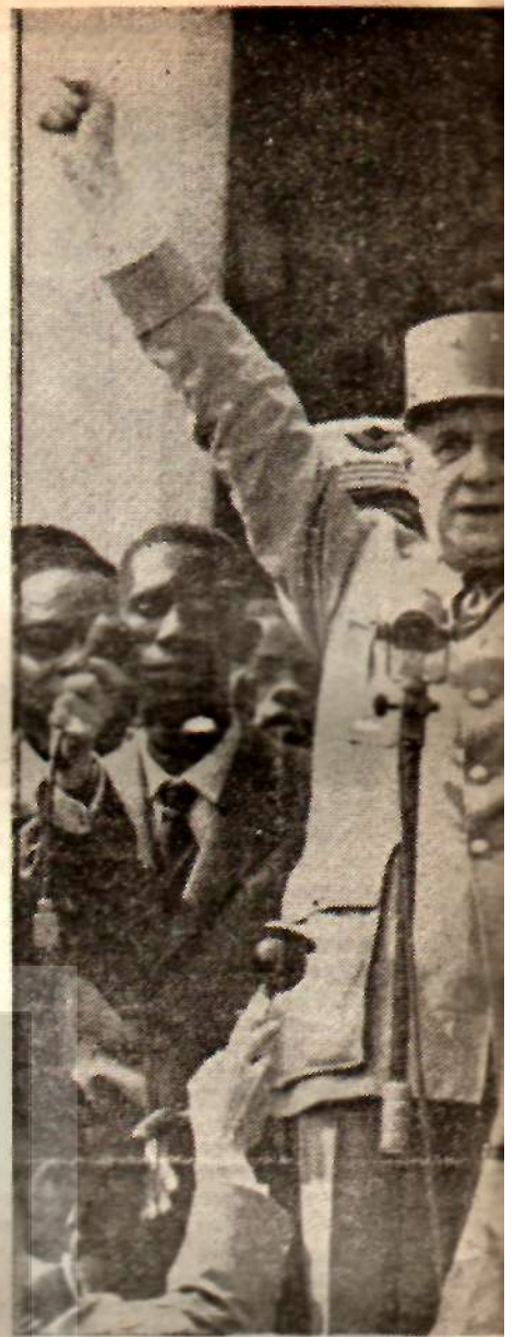
General de Gaulle, Afrika Üçüncü Dünya

«Hayatî çıkarları söz konusu olunca Amerika tek başına harekete geçmekte haklıysa, öteki ülkelerin ve özellikle Fransa'nın da (meselâ Küba ile ticaret, Çin'in tanınması v.s. gibi meselelerde), aynı şekilde davranmasını kabul etmesi gerekir. Ama yalnızca kendi çıkarları söz konusu değilse ve bütün Batı Dünyasını büyük risklerle karşı karşıya bırakıyorsa, Amerika'nın başma buyruk davranış hahk-