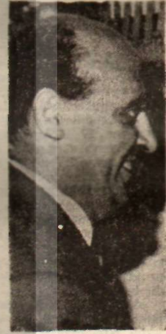
Başbakan Demirel Anayasa va mı? Va...