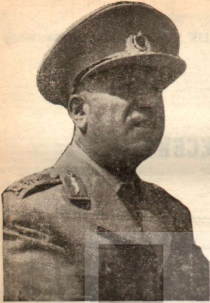
Orgeneral Cemal Tural